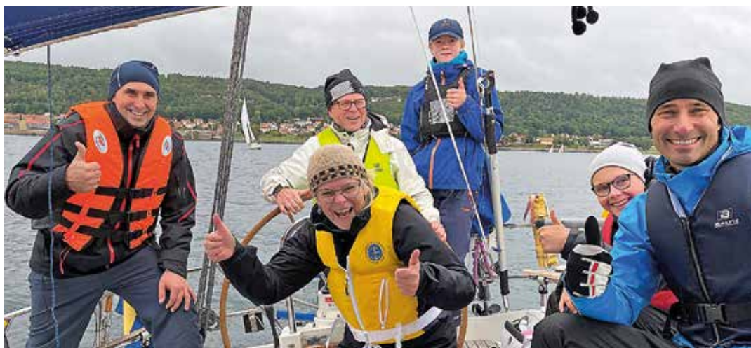
Glada elever på Jönköpings Segelsällskaps vuxenseglarskola hösten 2020. Och ny kurs planeras för 2021.

Kursen genomförs under två söndagar och som kursmaterial