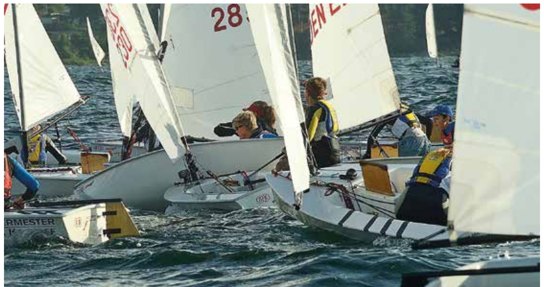
Zoom 8:or under JNOM i Båstad 2018.

UNDER VÅREN HADE de två gemensamma träningar. Det är fem återkommande personer, från