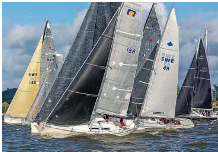
Alla kappseglingar börjar i Sailarena.

ALLT FLER KLUBBAR använder Sailarena som ett skyltfönster för sitt evenemang och som ett sätt att kommunicera med deltagarna. Där finns oftast inbjudan, anmälningsfunktion och många gånger också anslags-