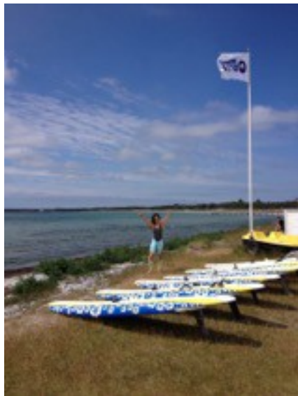
Bild: Instruktör Desirée Ekberg hurrar för en perfekt dag på jobbet

Denna klubb är regionens starka nykomling. Över 100 människor har i anknytning med Kvsk kommit ut på en bräda. Ungefär 60 procent av dem har tagit en kurs och därmed fortsatt. De ekonomiska utsikterna för klubben ser goda ut.