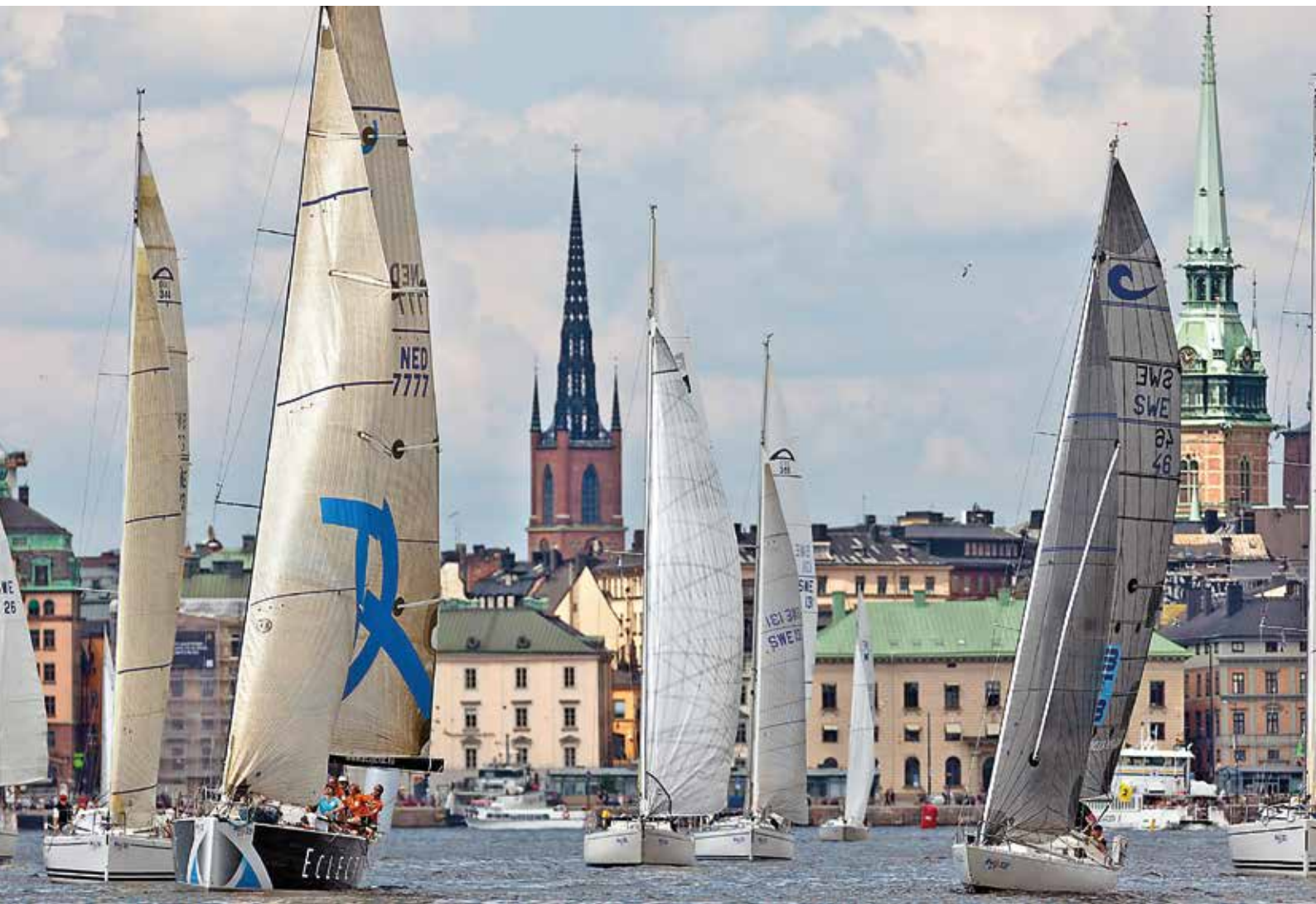
ÅF Offshore Race – en av många SRS-tävlingar.